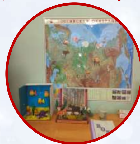
Путешествие по карте