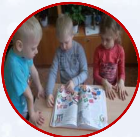
Рассматривание книг, энциклопедий