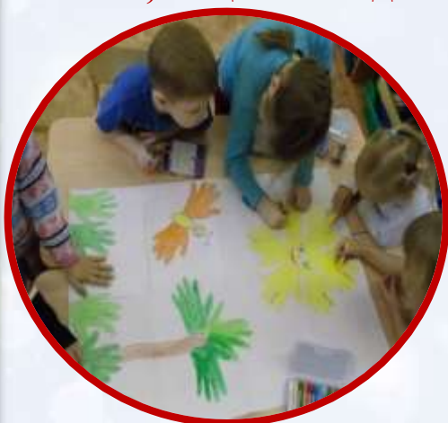
Создание плакатов, самодельных книг